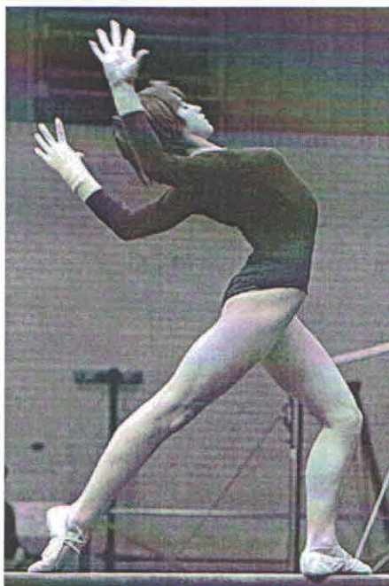
Надя Команечи. 1977

Наскок — это начало комбинации. Наскоки могут быть как простыми прыжками (с поворотами и без), так и гимнастическими элементами (круги, перемахи, высокий углы, горизонтальный упоры с последующим выходом в стойку на руках и без), а также сложными акробатическими элементами (перевороты и сальто).